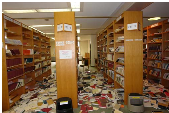
写真2 中央図書館 2階

分室：落下図書資料 40,000 冊（60%）、スチール書架の傾斜（90 台）・固定ボルト破断、壁面タイルの亀裂・崩落、壁面亀裂