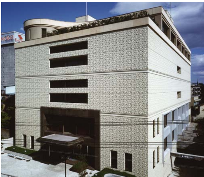
写真 1 中央図書館

東北学院大学は、文学部、経済学部、経営学部、法学部、工学部、教養学部 6 学部と、文学研究科、経済学研究科、経営学研究科、法学研究科、工学研究科、人間情報学研究科、法務研究科 7 研究科からなる、仙台市と多賀城市に 3 キャンパスをもつキリスト教系総合大学である。そして、12,000 名の学部学生、210 名の大学院生、312 名の専任教員、197 名の専任職員を擁している。