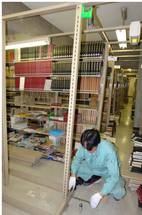
写真5 中央図書館 ゆがみ計測

4月に入り書架の本格的修理のため設置業者による点検を実施したが、その結果は予想をはるかに超える深刻な状況であった。中央図書館では、閉架書庫の書架の3割の組み直し、分室の書架の全般的修理、泉キャンパス図書館では、開架書庫の木製書架すべての組み直し、地下移動書架のゆがみ修理などであった。このため復旧計画も、落下図書資料の書架への戻し作業から、書架修理準備のための作業へと変更が必要となった。使用可能な書架への戻し作業は続行しつつも、書架修理のため書架に残された図書、いったん戻した図書をすべて要修理書架より他の場所へ移動することが必要となり復旧作業の長期化を余儀なくされた。