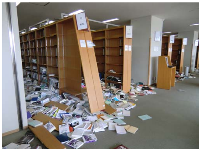
写真4 泉キャンパス 2階

泉キャンパス図書館：落下図書資料 190,000 冊（70%）、木製書架の傾斜（297 台）、壁面タイルの亀裂・崩落、壁面亀裂、パソコン転倒（利用者用 3 台、）、保存書架（地下）の傾斜