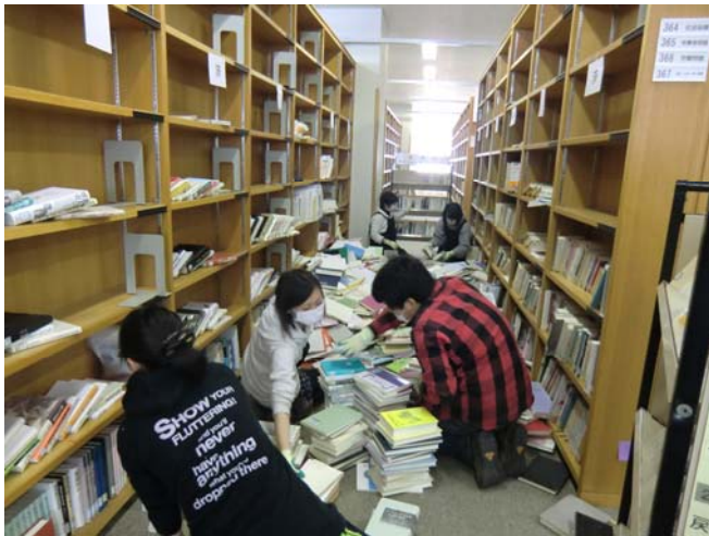
写真6 学生ボランティア

特別の知識は必要としないが苦勞の多い単純作業であることに対する学生諸君の協力は高く評価すべきである。