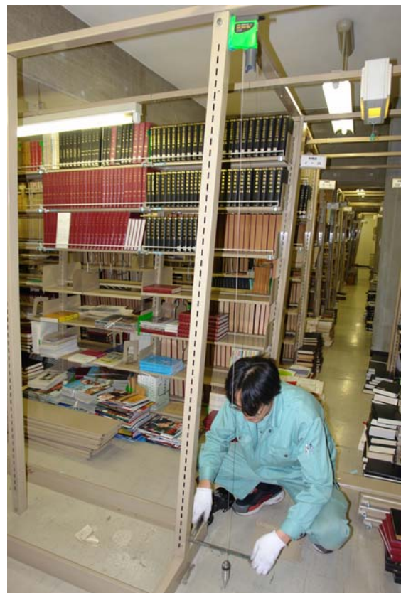
写真5 中央図書館 ゆがみ計測